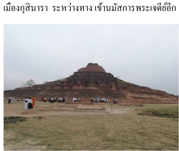
เมืองกุสินารา ระหว่างทาง เข้ามัสการพระเจดีย์อีก

ซึ่งพื้จะค้นพบ กล่าวกันว่า เป็น เจดีย์ที่เก็บบาตรของพระพุทธองค์ ชื่อเกสระिया เป็นเจดีย์ที่ใหญ่มากและยังมีกล่าวอีกว่า เป็นที่พระพุทธองค์ ทรงแสดง กาลามสูตร